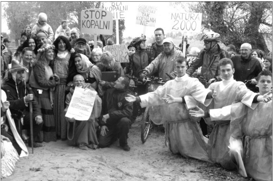
Kniend bitten die Flurbewohner Aus Reußen und Muchorowo den Hohen Herren Nikolaus Kopernikus um Führsprache.