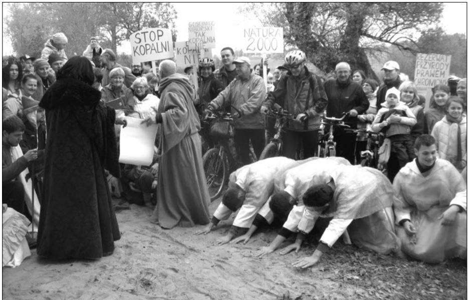
"Hoher Herr hilf uns..."