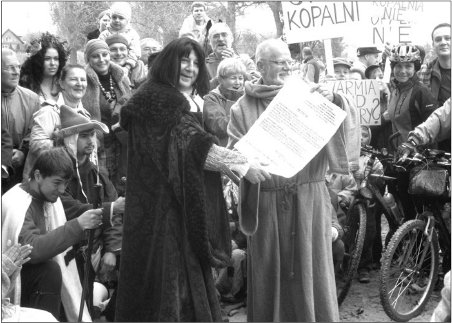
Übergabe der Bittschrift