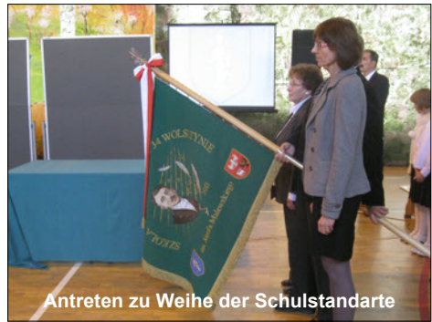
Antreten zu Weihe der Schulstandarte