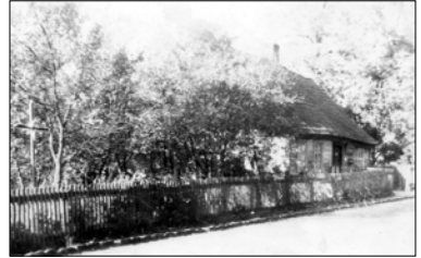
Wieczoreks Haus vom 1963 (Straßenseite)